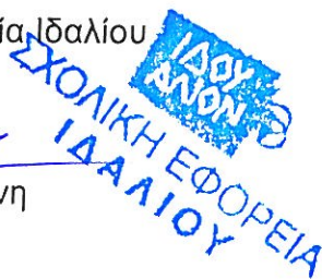
Αγγελα Χ' Γιάννη Πρόεδρος

Κοιν: Σύνδεσμο Εργολάβων (22751664) Συμβούλιο Εγγραφής και Ελέγχου Εργοληπτών ( concounc@cytanet.com.cy ) Γραφείο Τύπου και Πληροφοριών ( ads@pio.moi.gov.cy )